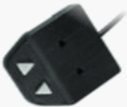
Desk panel (example)