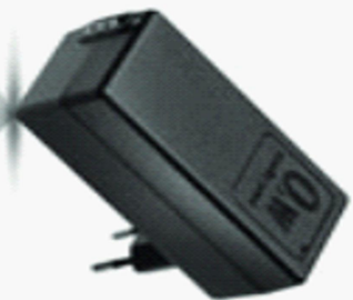
SMPS + cable