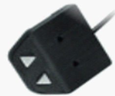
Desk panel (example)