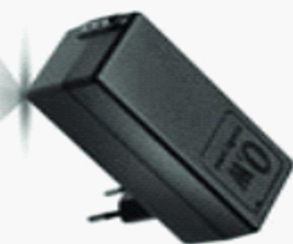
SMPS + cable